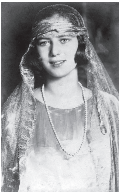
Fig. 1 – Principesa Ileana a României.