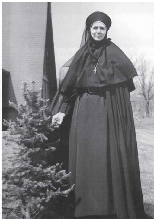
Fig. 2 – Principesa Ileana – maica Alexandra (cca 1971).